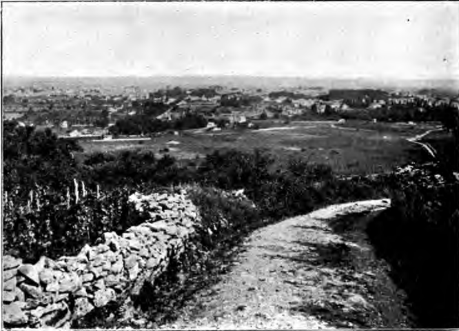
Beaune. — Vue générale.